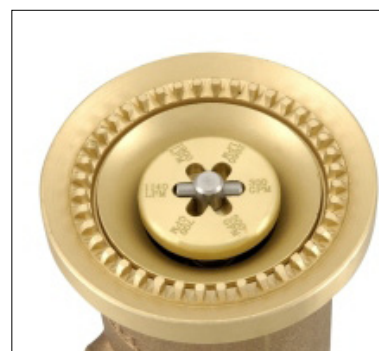
Detalhe do Seletor de Vazão