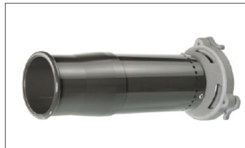
Lança modelo LE221

Os Esguichos Modelos SV 822A e SV 822B podem ser dotados de lança de espuma modelo LE221, para operações com espuma de combate a incêndio e formação de colchão de espuma com expansão elevada. A lança de espuma modelo LE221 é de fácil e rápida montagem nos esguichos. Fabricada em polietileno e liga leve de alumínio, dependendo das condições, pode expandir a espuma em até 1:20.