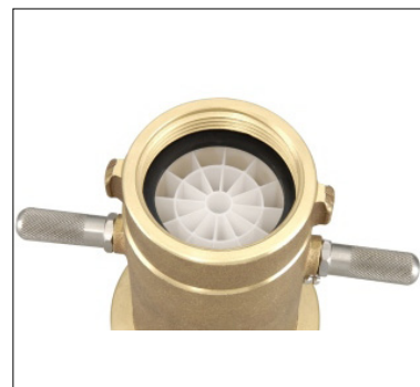
Detalhe do Tubo Laminador